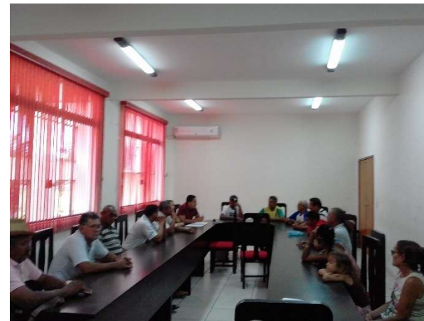
REUNIÃO COM FEIRANTES VENDEDORES DE CARNES, VISA MUNICIPAL E GERÊNCIA DE FEIRA COBERTA – 22/03/17