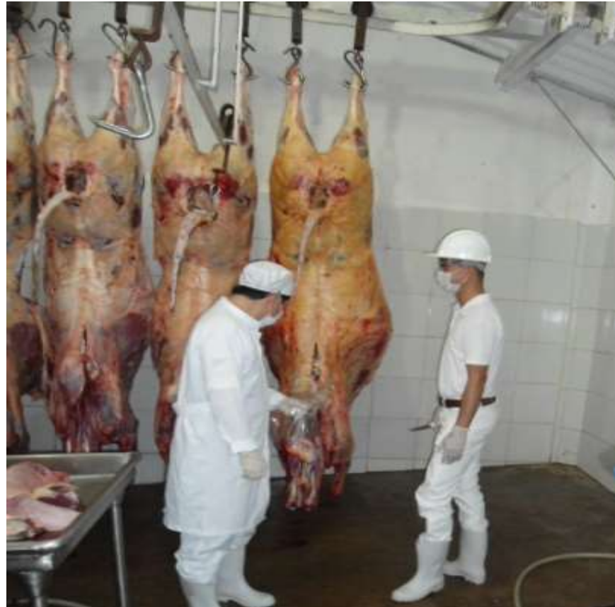
FISCALIZAÇÃO NO MATADOURO SÃO RAIMUNDO