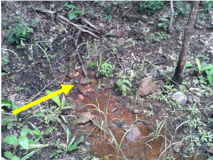
NASCENTES DO RIBEIRÃO TRANQUEIRA

IDENTIFICAÇÃO DA NASCENTE DO RIBEIRÃO TRANQUEIRA - 08/03/2017