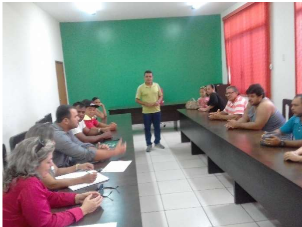
REUNIÃO COM FEIRANTES DE PRODUTOS IMPORTADOS – 08/02/17