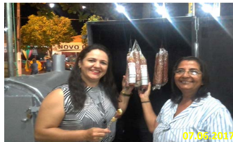
EXPOSIÇÃO DE PRODUTOS DE ORIGEM ANIMAL DA FÁBRICA ROSA ALIMENTOS NO 28ª EXPOGUARAÍ – 2017.