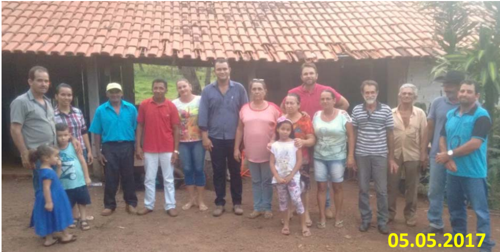
ASSOCIAÇÃO DOS PRODUTORES RURAIS DO VALE DA TRANQUEIRA E JANDAÍRA – ASTRAJA –