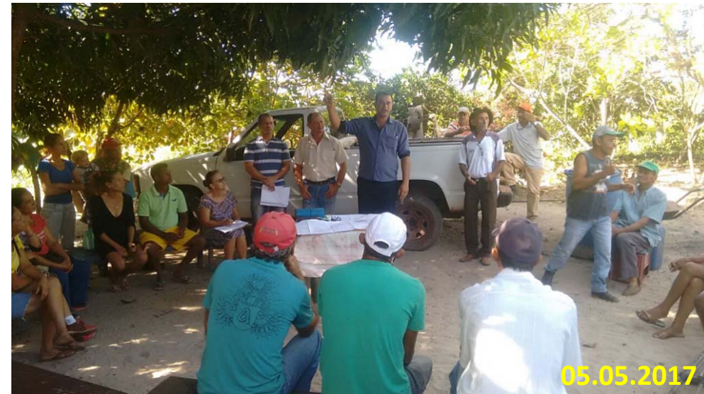
LEVANTAMENTO DE DEMANDAS JUNTO AOS PRODUTORES RURAIS - PA Pedra Branca -