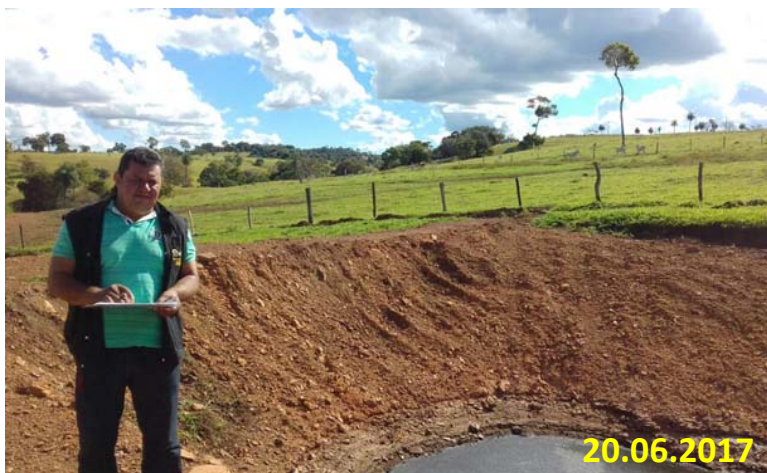
INSPEÇÃO NA CONSTRUÇÃO DAS LAGOAS DE ESTABILIZAÇÃO DO MATADOURO SÃO RAIMUNDO