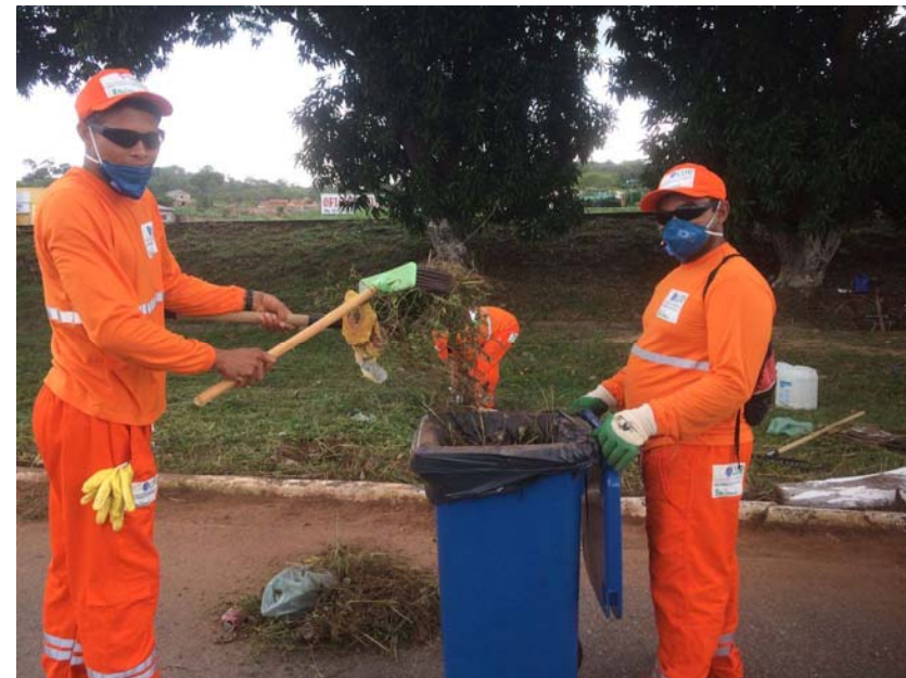
Garis equipados com EPI's