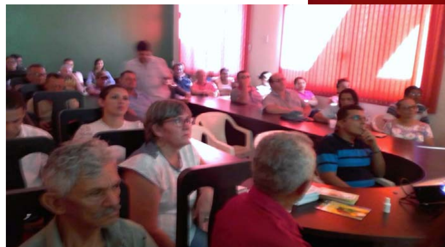
PALESTRA COM OS PRODUTORES DE PRODUTOS DE ORIGEM ANIMAL COM A SUPERVISORA ESTADUAL DE AGRICULTURA.