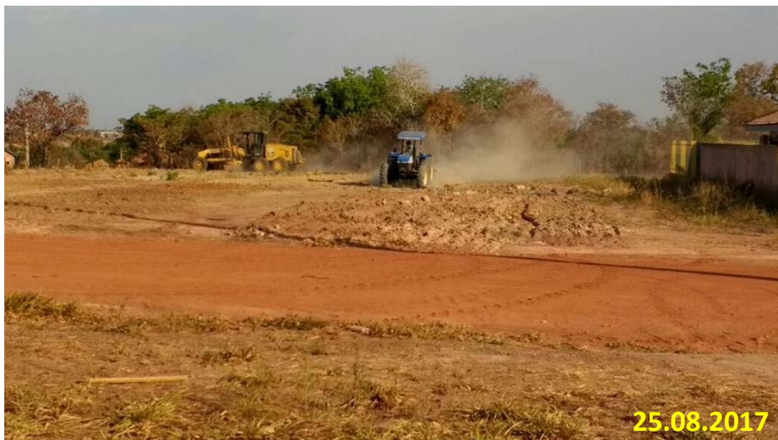
LIMPEZA E NIVELAMENTO DA ÁREA