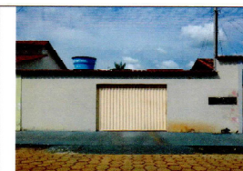
Figura 02 – vista da casa, portão Fechado.