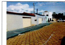
Figura 01 – Rua da Saudade, vista da casa.