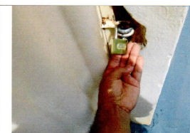
Figura 04 – Confirmação do Cadeado do portão fechado.