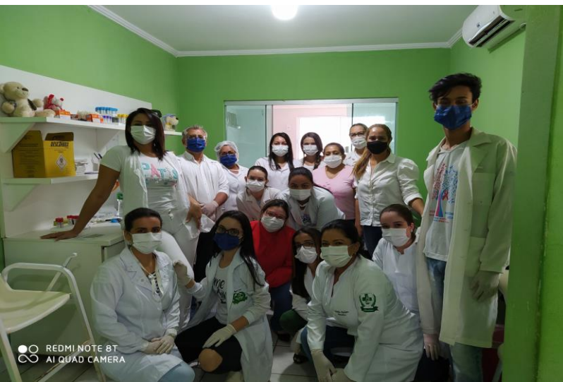
Triagem TR - COVID – 19 servidores da Faculdade IESC