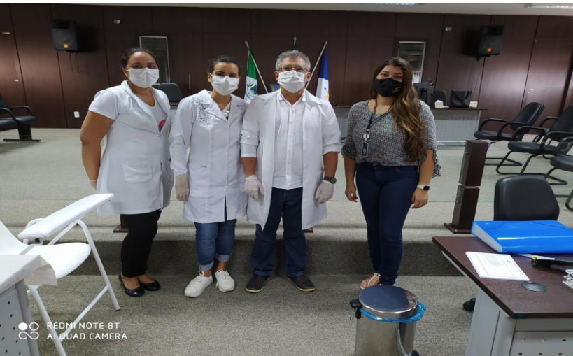
Triagem TR - COVID – 19 servidores FORUM