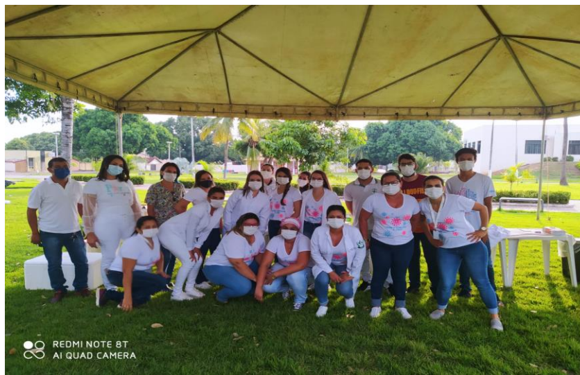
Ação Guaraí vencendo a COVID - 19