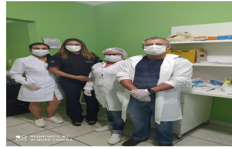
Triagem TR - COVID – 19 servidores PROCON